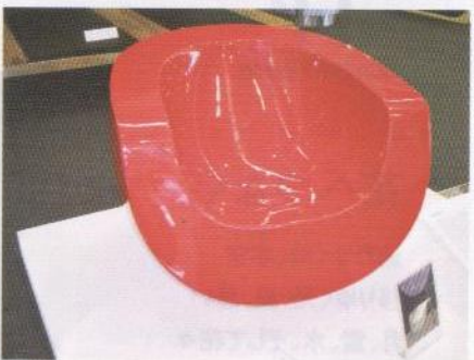
アーバン・オブジェクト・クリエイション社の「ムーンチェア」(FDA)

する。シンガポール国際家具産業協会は同プロシエクトを通して、起業家精神、創造性、革新性に優れた企業またはデザイナーを表彰する。