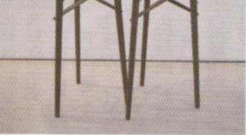
エアディビジョン社の「スプラウト・パニティ・スタンド」(FDA)