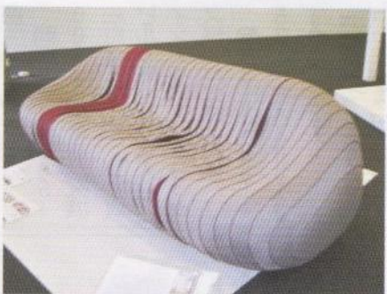
シリコンフェイトリー社の「ブロコ」(FDA)