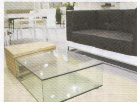
ユーヨーク社のソファとローテーブル