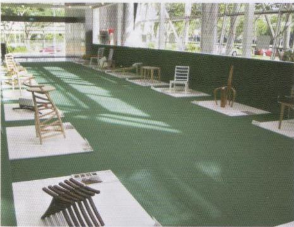
デザインコンペ「フリップ・チャレンジ」の様相