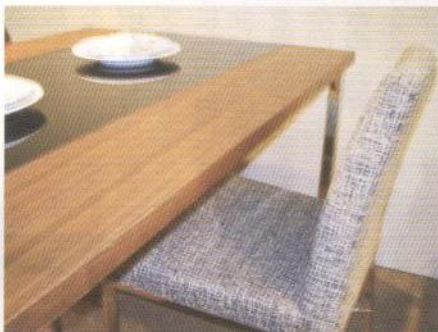
コダ社のダイニングセット「プラットフォーム」