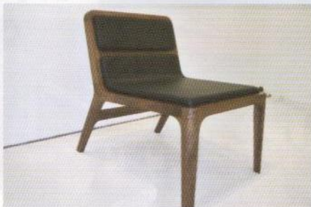
エアードイビジョン社の「グラップ・ラウンジチェア」