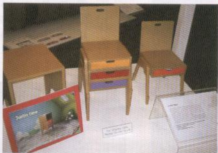
ジャポネライスタジオ社の「ジャスティンタイム」(ファニチャーデザインアワードへ出品)

イで3月3日から3月15日にかけて順次開催される、6つの家具見本市を指す。全体で1000社以上が展示総面積25万平方メートルに多様な製品を出展し、世界中のバイヤー及び業界関係者がアセアンの家具を一度に視察できるプロジェクトである。