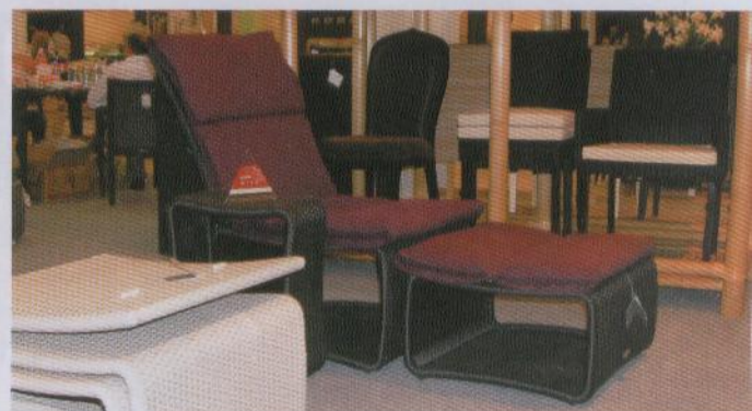
Praktisch und platzsparend: Ausklappbarer Outdoor-Sessel von Domus Ventures.

Schaufenster der asiatischen Möbelindustrie konnte in der Zwischenzeit erkennbar geschärft werden. Typisch für Singapur ist zudem, dass die Messe schwerpunktmäßig das asiatische Möbelschaffen im mittleren bis gehobenen Genre abbildet, preisaggressive Angebote sind im Vergleich zu diversen Wettbewerbs-Events dagegen weniger zu finden. Das Ergebnis sind in der Breite wertige und attraktive Präsentationen, die sich durch alle sechs Messehallen durchgezogen haben.