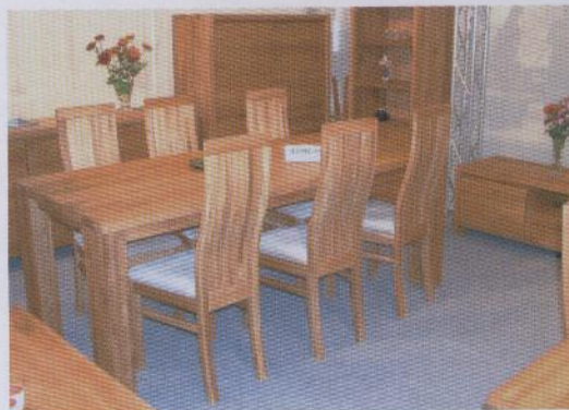
Wird im Mai auf dem M.O.W.-Stand von Easy Chair zu sehen sein: Eiche-Essgruppe von Haleywood.