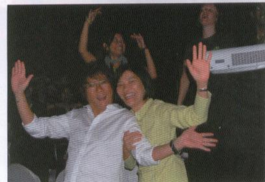
Von Krise keine Spur: Selten zuvor herrschte auf der Buyers' & Exhibitors' Night mit ihren rund 800 Teilnehmern eine derart ausgelassene Stimmung.