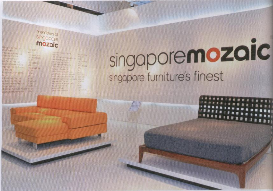
Die Präsentation der im vergangenen Jahr erstmals vorgestellten B2B-Marke Singapore Mozaic nahm auf der IFFS/AFS breiten Raum ein.