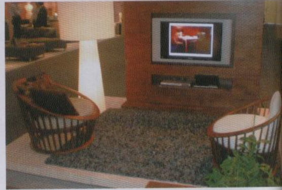
Ausgezeichnet mit dem Best Exhibit Award: Wohnzimmer-Einrichtung mit Mediawand von Air Division.

Fast so, als gäbe es keine Krise, startete die Singapur-Möbelmesse. Am ersten Tag der IFFS/AFS sah es in den Messehallen ähnlich umtriebiger aus wie in den Vorjahren. Besonders geschäftig ging es in Halle 6 zu, wo die großen Singapur-Unternehmen zuhause waren, sowie in den Hallen 7 und 8, der „Heimat“ einiger bedeutender Polsterer. Anscheinend hat sich die im Vorjahr erstmals praktizierte Verlegung des Messetermins positiv ausgewirkt. Nachdem die IFFS/AFS terminlich näher an die großen China-Events rückte, starten zahlreiche Einkäufer ihre Fernost-Tour in Singapur, um dann über Zwischenstopps in Jakarta, Ho Chi Minh City oder Bangkok nach Dongguan und Guangzhou weiterzureisen.