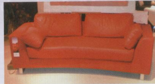
Lounge Innovation aus Australien profiliert sich als Produzent öko-freundlicher Polstermöbel. Verarbeitet werden u. a. Straußen-, Krokodil- oder Känguru-Leder, wobei keines dieser Tiere speziell für die Lederproduktion getötet wird.

471 Aussteller aus 33 Ländern beteiligten sich an der rund 60.000 qm großen IFFS/AFS 2009. Fast 30% aller Teilnehmer konnten in diesem Jahr ihre Singapur-Premiere feiern. Das Gros aller auf der Messe vertretenen Unternehmen kam wieder aus Asien. Neben Singapur sind dabei vor allem die Beteiligungen aus China, Hongkong, Indonesien, Taiwan und Vietnam hervorzuheben. Von den großen außereuropäischen Präsentationen, die das Bild der Singapur-Messe vor rund zehn Jahren noch mitprägten, sind lediglich Einzelauftritte von Firmen aus Großbritannien, Australien, Belgien, Frankreich oder der Türkei übrig geblieben. Der Attraktivität dieser Veranstaltung hat diese Entwicklung nicht geschadet. Im Gegenteil: Das Profil als