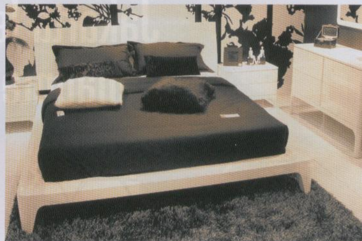
Auf schwarzen und weißen Hochglanzlack setzte die Star Furniture Group aus Singapur.