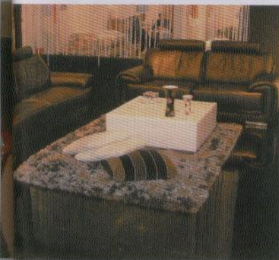
HTL stellte auf der Messe einen Auszug seiner aktuellen Kollektion aus, lud seine Kunden aber auch in den großen Showroom am Firmensitz in Singapurs Stadtteil Jurong.