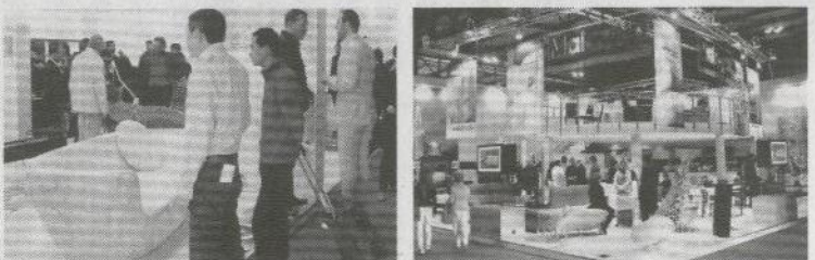
⑤人気ブース「Moroso」。日本のnendo、吉岡徳仁氏も出品した⑥カリム・ラシッド氏(右端)も来場したシンガポール「モザイク」⑦マレーシアブース