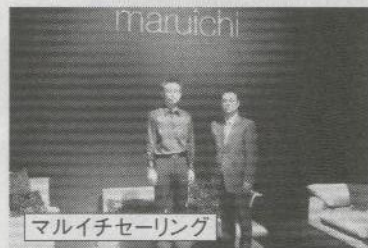
マルイチセーリング