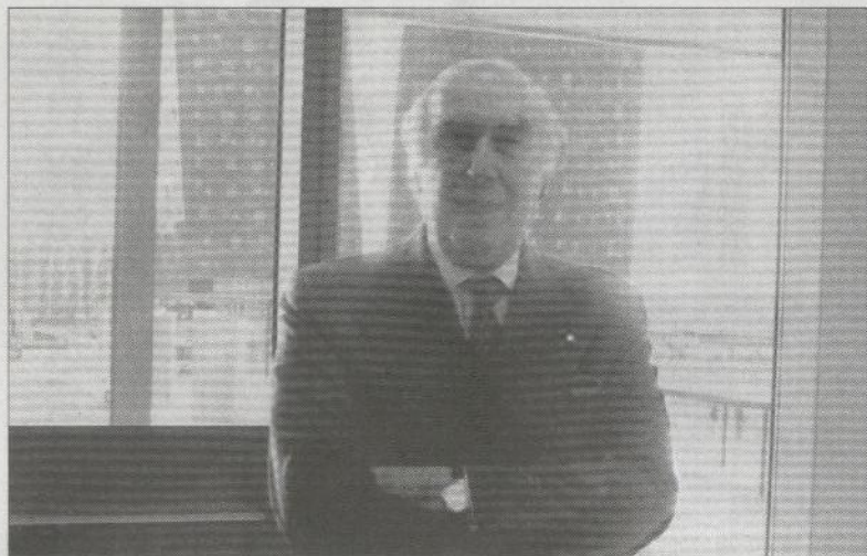
アルメリーニ氏のオフィスにて。バックにV字型のホテルが見える