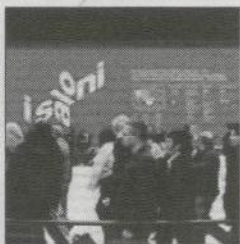
プレス入口に殺到する来場者