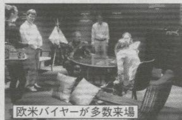
欧米バイヤーが多数来場