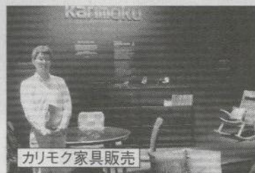
カリモク家具販売